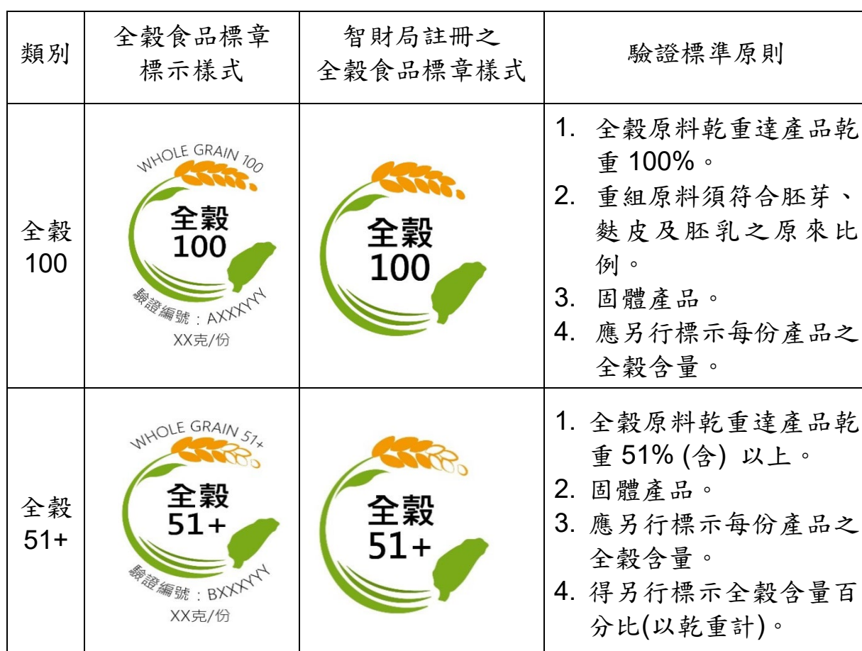
表一、全穀食品標章